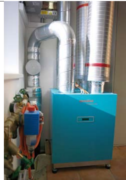
Kontrollierte Lüftung mit Wärmerückgewinnung.

form (z. B: Fotovoltaik als „fliegendes“ Beschattungselement und thermische Kollektoren integriert, passive Solar-nutzung zur Wohnwertsteigerung und dergleichen).