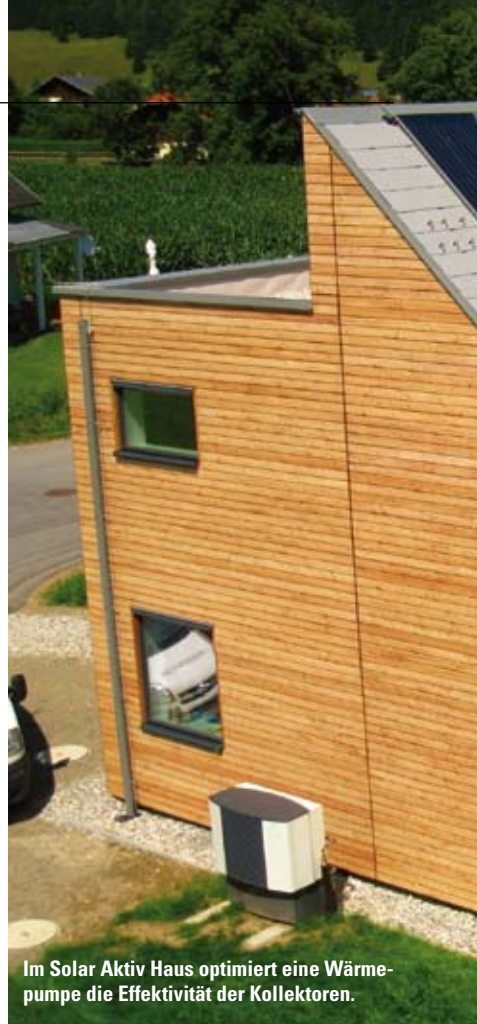
Im Solar Aktiv Haus optimiert eine Wärmepumpe die Effektivität der Kollektoren.

hoch angesetzt (maximaler Primärenergiebedarf: 120 kWh/m 2 .a). Die Passivhauslimits in den Wohnbauförderungskriterien konzentrieren sich zu sehr auf den Heizenergiebedarf und vernachlässigen die letztlich weit wichtigere Gesamtenergie- und Ökobilanz. Als eine Art der „Weiterentwicklung“ zielt daher das Solar Aktiv Haus-Konzept auf eine ökologische und energetische Gesamtoptimierung.