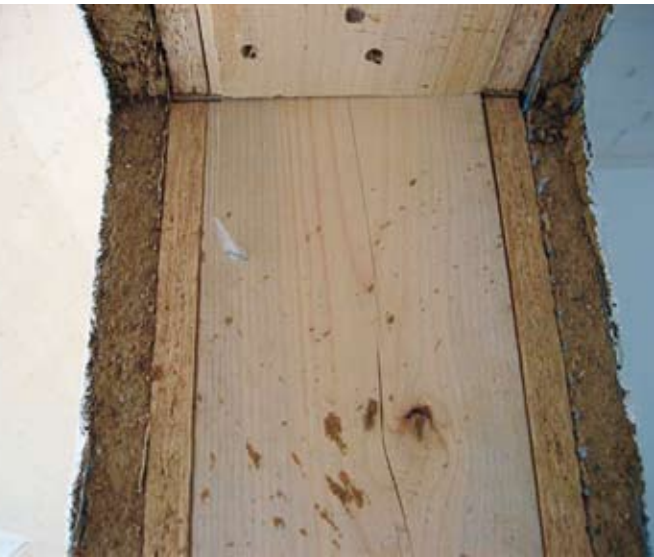
Holzkonstruktion gefüllt mit Zellstoff und mit Lehm verputzt.