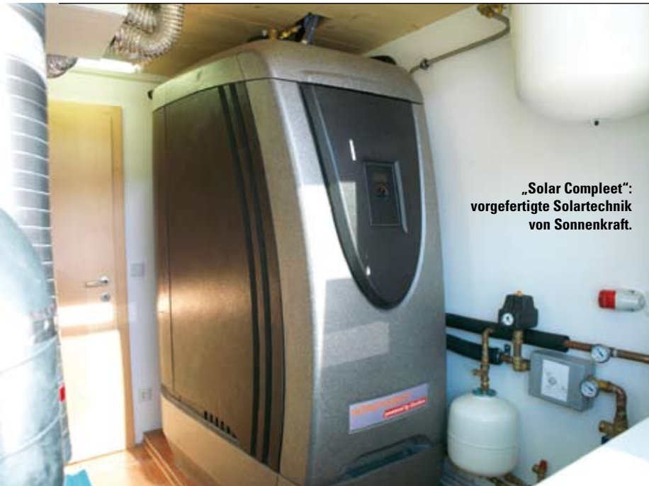
„Solar Compleet“: vorgefertigte Solartechnik von Sonnenkraft.