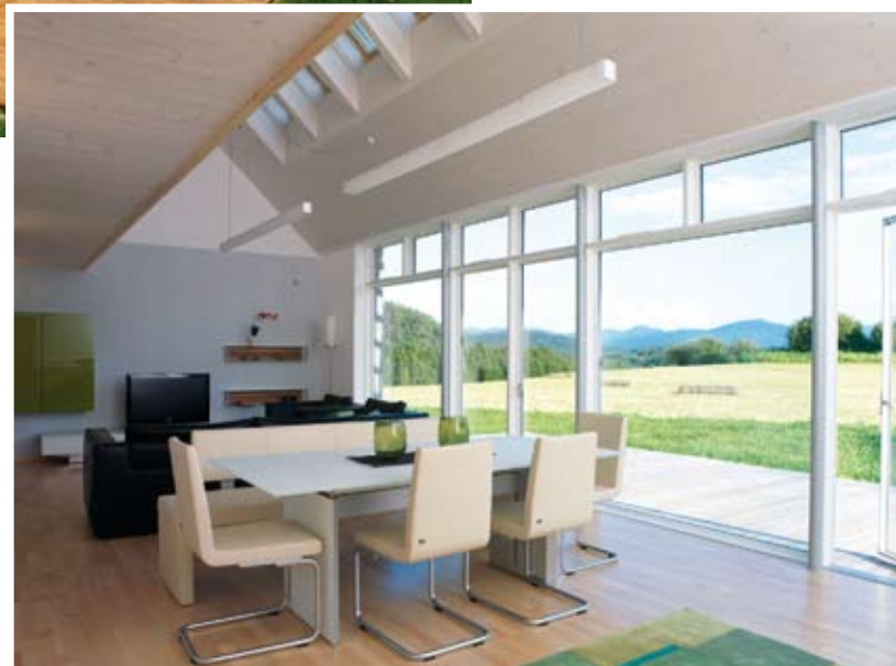
Einbeziehung der Landschaft und passive Solarnutzung.

Die dem Solar Aktiv Haus zu Grunde liegende Architektur sieht sich nicht als formalistisches Konzept, sondern als Architektur, die ihre Formen und ihre ästhetischen Vorteile aus der Beantwortung der anstehenden ökologischen Fragen ohne „Schnörkel“ ableitet.