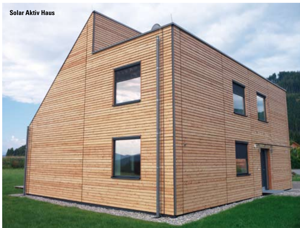
Solar Aktiv Haus

In diesem Rahmen wird dem Benutzer ein Haus geboten, das nicht nur zukunftssicher ist, sondern für den Durchschnittsverbraucher auch gut konsumierbar.